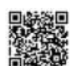
扫码看辣视频 探访AI视频制作

作为国家级文化产业示范园区,马栏山2023年便为创壹科技拍摄《柒两人生》提供了全方位支持,不仅开放4K超高清演播厅、虚拟拍摄棚等硬件设施,更依托“马栏山云”平台提供高效渲染与AI算力支撑,助力其实现影视级视效与AIGC技术的深度融合。